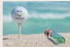
ゴルフバージョン

ゴルフ、アウトドア、フラワー、 世界の風景、動物など、 プライベートからビジネスまで 幅広く使える写真を取り揃えました。