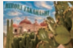
世界の風景バージョン